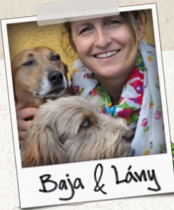
Baja & Lány